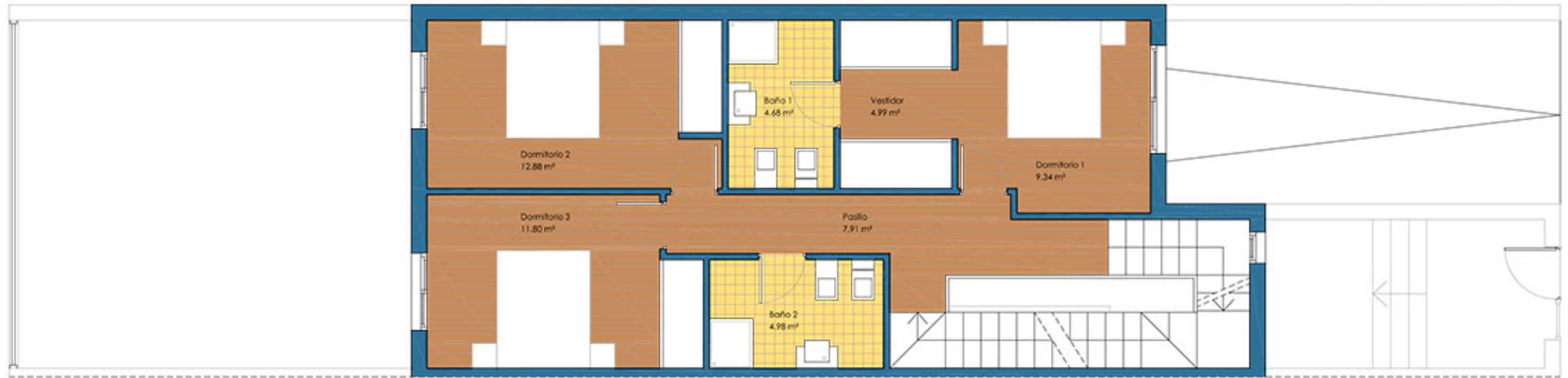
PLANTA 1º SUP. ÚTIL 56.68 m 2 SUP. CONSTRUIDA 65.69 m 2