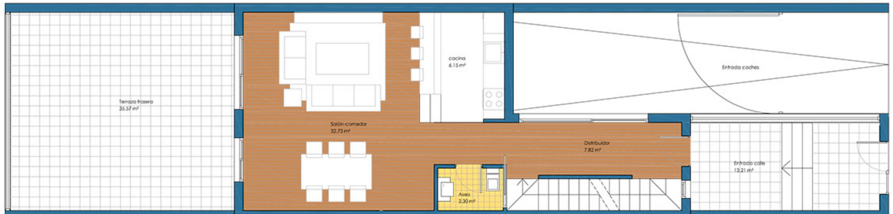
PLANTA BAJA SUP. ÚTIL 48.58 m 2 SUP. CONSTRUIDA 56.86 m 2